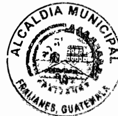
Marco Tulio Meda Alcalde Municipal Fraijanes, Guatemala